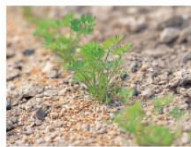
ニンジンの発芽 (本葉展開)