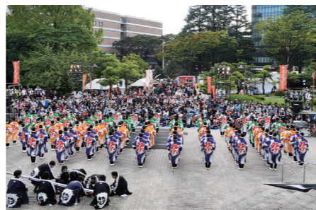
チームの演舞の様子