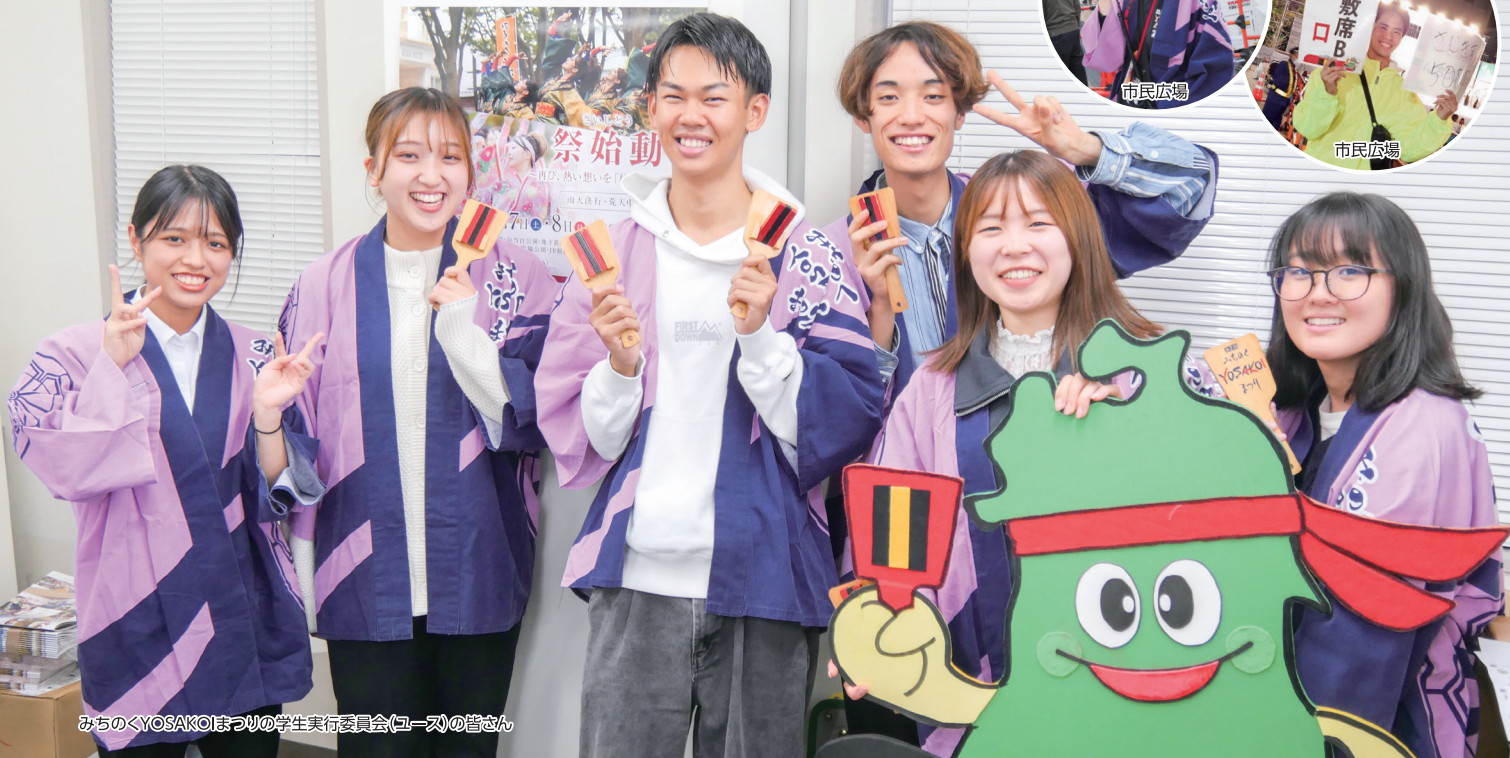
みちのくYOSAKOIまつりの学生実行委員会(ユース)の皆さん