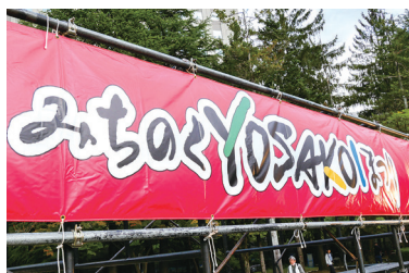
第26回みちのくYOSAKOIまつり

「民謡で東北おこし」「市民の創造力と独自性で東北おこし」「百万都市・仙台でふるさとPR」の3つの理念を具現化し、東北の地域活性化を目指そうと、今年も盛大に開催されました。その舞台裏では、みちのくYOSAKOIまつりの学生実行委員会(ユース)の皆さんがボランティアとしてイベントの準備や運営を支えていました。