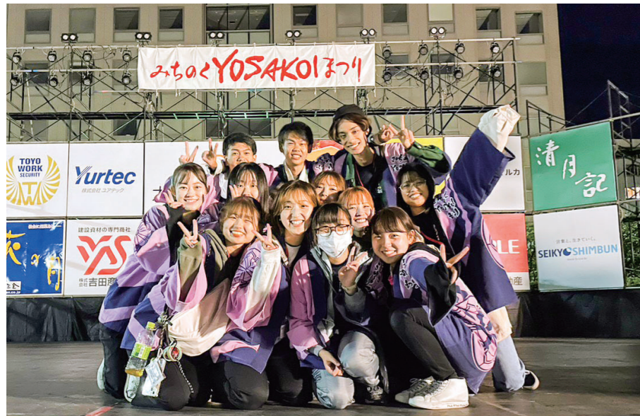
みちのくYOSAKOIまつり学生実行委員会(ユース)メンバーの皆さん