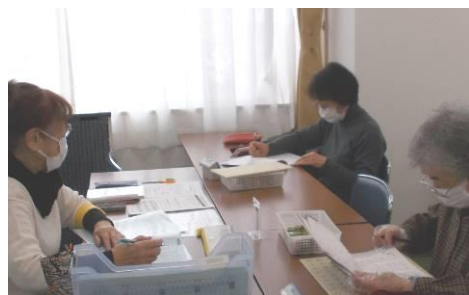
計算と音読のプリント