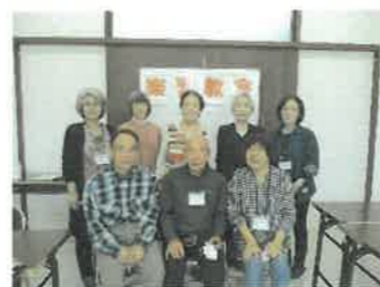
第37期で楽習された方々