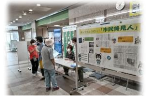
【パネル展示の様子】

今年度は、本センターと協働で市民後見人の活動を紹介するオリジナルのチラシを作成し、「福祉プラザまつり」の情報コーナーにおいてパネル展示や同チラシの配布を行いました。